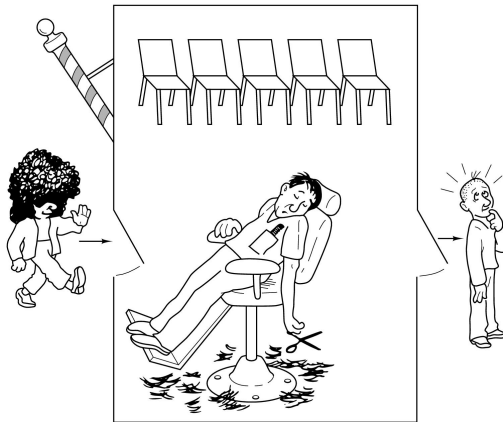
Tanenbaum: Figura 1.20